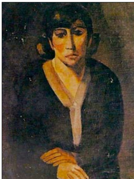
Na Hye-soks självporträtt, slutet av 1920-talet

man men inte ville skiljas. Att Na Hye-sok skulle ha samma rätt till utomäktenskapliga relationer som sin make var det inte tal om. Hon utsattes för smutskastningskampanjer, hennes författarskap och konstnärskap förpassades till periferin och hon förlorade sitt hem och sin inkomst. Na Hye-sok dog 1948 på en fattigvårdsinrättning och både hennes författarskap och hennes konstnärskap utelämnades från det officiella kulturarvet.