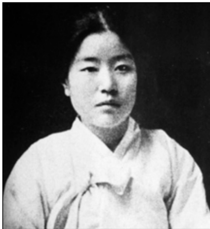
Na Hye-sok 1915

Parks kulturminister, Cho Yoon-sun, är dömd till två års fängelse för att ha upprätthållit den svarta listan och den nuvarande kulturministern har å regeringens vägnar bett de listade om ursäkt för hur staten har behandlat dem. Park Geun-hye är till dags dato dömd till 32 års fängelse för maktmissbruk, korruption och olaga tvång, bland annat för att ha tagit emot pengar från landets underrättelsetjänst. Lee Myung-bak är åtalad för maktmissbruk, korruption och olaga tvång och hittills dömd till 15 års fängelse för korruption – för att ha gått de stora ekonomiska intressenas ärenden och bland annat gett säkerhetstjänsten order att obstruera arbetet för landets två största fackförbund. Tiden hann ikapp Lee efter att oppositionen hade utnyttjat de sprickor som fanns inom regeringspartiet, fått Park Geun-hye avsatt och satt rättsväsendet i funktion. Till saken hör