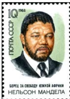
”Den sydafrikakanske frihetskämpen Nelson Mandela.” Sovjetiskt frimärke från 1988.

Nelson Mandela och hans kamrater var politiska fångar. I breven till fängelsemyndigheterna framhöll han, förgäves, upprepade gånger att de borde erkännas som sådana. Ett indirekt och oavsiktligt medgivande att de satt inne av politiska skäl finns dock till exempel i motiveringen till att ett brev till parlamentsledamoten Helen Suzman 1974 stoppades: ”Eftersom brevet inte tar upp familjeangelägenheter utan endast politiska åsikter och idéer hålls det härmed inne.”