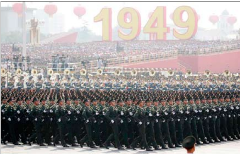
Kinesisk militärparad 2019 till 70-årsminnet av revolutionen.

och hittade snabbt kanaler som förmedlade den kinesiska televisionens rapporter om firandet.