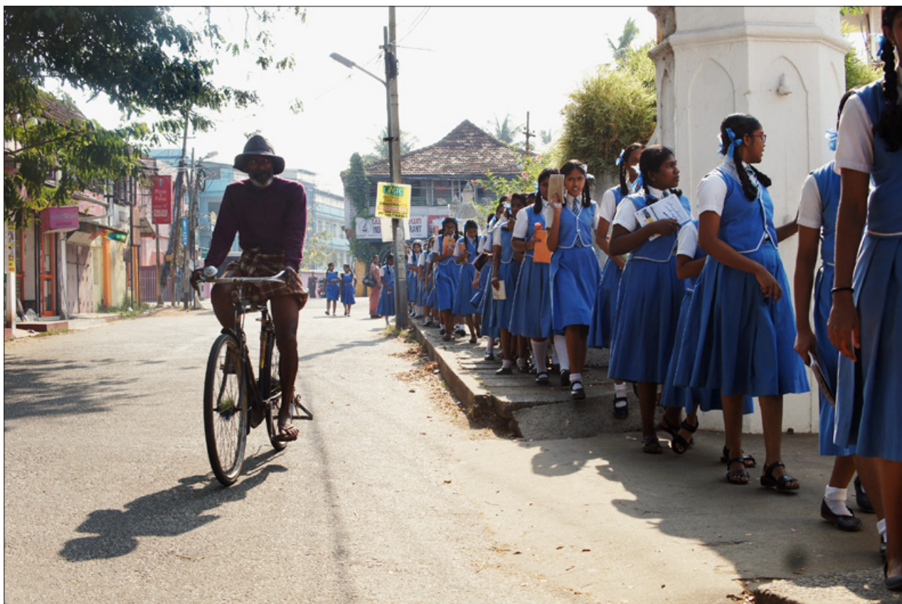
Hur ta sig från rädlans geografi till jämlik rörelsefrihet? Skolflickor i Kerala, foto Mikko Zenger.