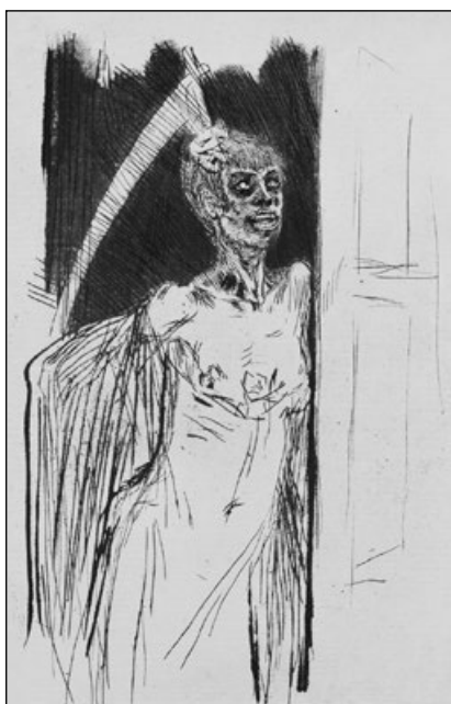
Félicien Rops: Mors syphilitica (1880).