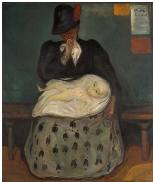
Edvard Munch: Arv (1897).

med penicillin kunde man kurera den. Och syfilis som via modern drabbar ofödda och nyfödda barn är inte utrotad: "i själva verket dog fortfarande år 2016 omkring 200 000 barn till följd av att deras mamma smittats av syfilis", enligt WHO.