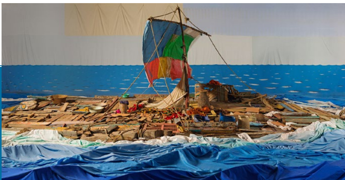
Foto från konstnären Adad Hannahs iscensättning av Théodore Géricaults målning Medusas flotte (Le Radeau de la Méduse, 1818–19), The Raft of the Medusa (Saint-Louis) (2017). adadahannah.com