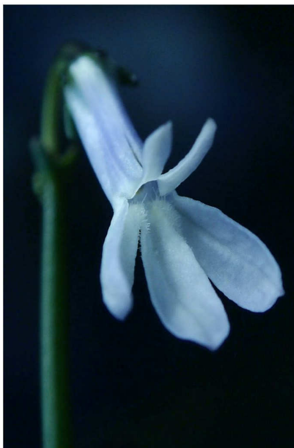
SPECIELLT. Ljuset väcker undervattensfotografierna till liv.

Värna om vattnets välbefinnande Det här är inte första gången Ala-