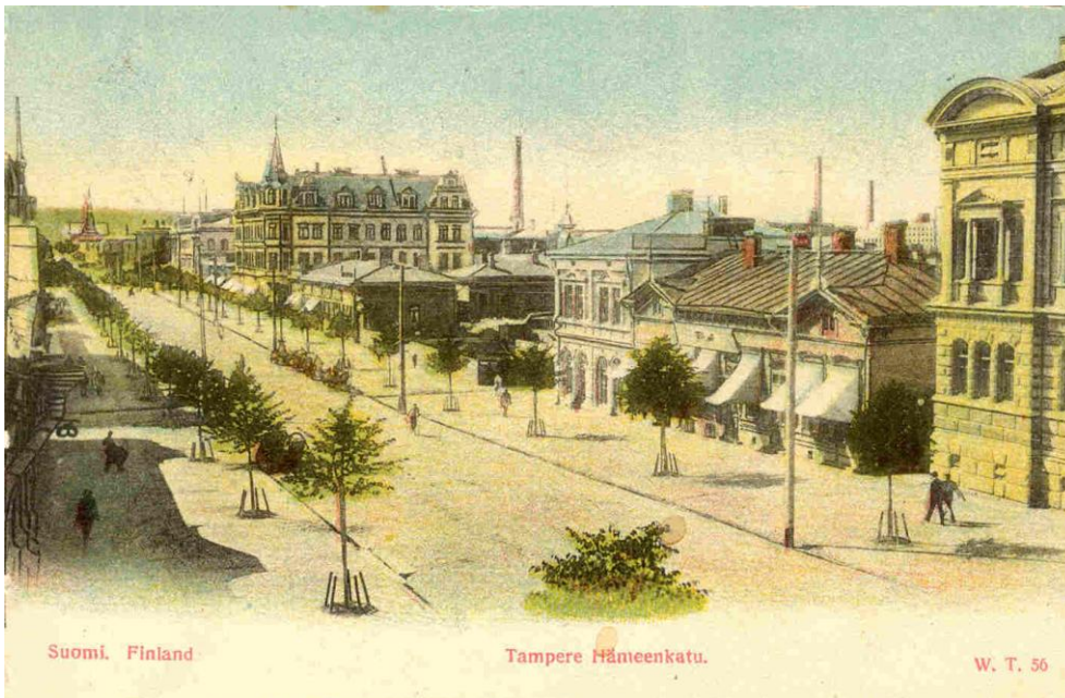
Hämeenkatu silloin kun esperanto tuli Tampereelle

Tiedot näin varhaisista tapahtumista ovat usein yksittäisiä tietoja vailla vahvistusta. Edellä mainitusta gruposta ei löytynyt mainintaa esim. vuosien 1904-06 Aamulehden numeroista, joissa kyllä on tietoja erilaisten seurojen ja yhdistysten toiminnasta ja perustamisesta.