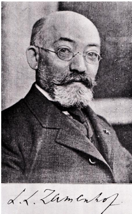
Ludoviko Lazaro ZAMENHOF

1887 Matkailu Suomessa lisääntyy, Matkailijayhdistys perustetaan.